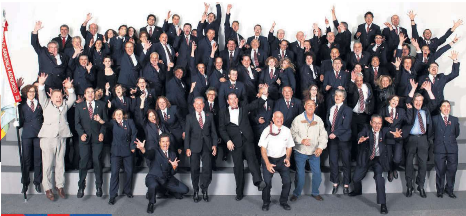
Festa nel Magnifico Borgo

Nel Mendrisiotto, oltre alla Civica Filarmonica di Mendrisio, ci sono altre 10 bande. Inoltre, come ben ricorda, durante l'anno ci sono diverse manifestazioni che hanno una lunga tradizione; la Passione di Coldrerio e le Processioni storiche di Mendrisio durante la settimana Santa, il concerto della Civica di Mendrisio del venerdì Santo, ma anche la Sagra del Borgo e il Palio degli asini a settembre e la Fiera di San Martino a novembre. È una regione che ha voluto e saputo conservare e riproporre dei momenti religiosi, culturali e di convivialità che uniscono le persone e valoriz-